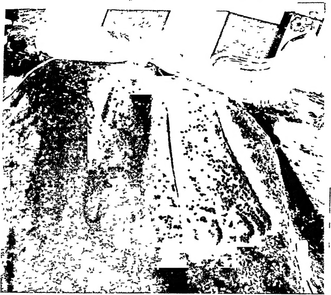
आचार्य कुन्दकुन्द के चरण-चिह्न, पोन्नूरमलै (तमिलनाडु)